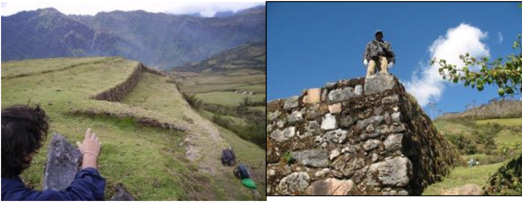
Aucaypata, o “plaza de la alegría”, en Pampaconas