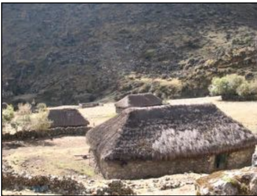
Paredes de roca en Porcay

Arriba a la derecha puente inca de Rumichaka Altitud. 4.262m.s.m. .S 13°16.598' // W 73° 5.320', Abajo Choquetira