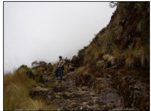
Subida al Abra Dolores