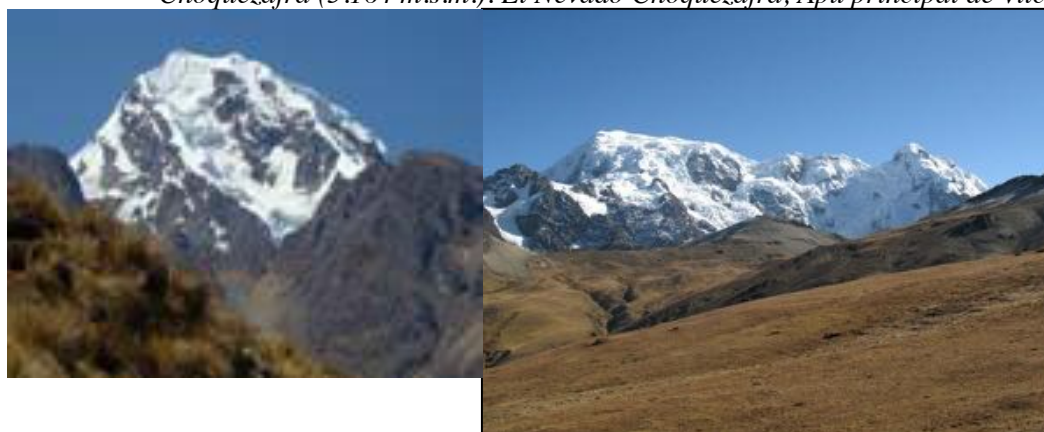
El Nevado Panta

La escalada al nevado Azulcocha, de 5.800 m.s.m., fotografiar sus lagunas y difundir esta nueva vía en publicaciones especializadas son algunos de los objetivos del proyecto Ruta XV en 2010