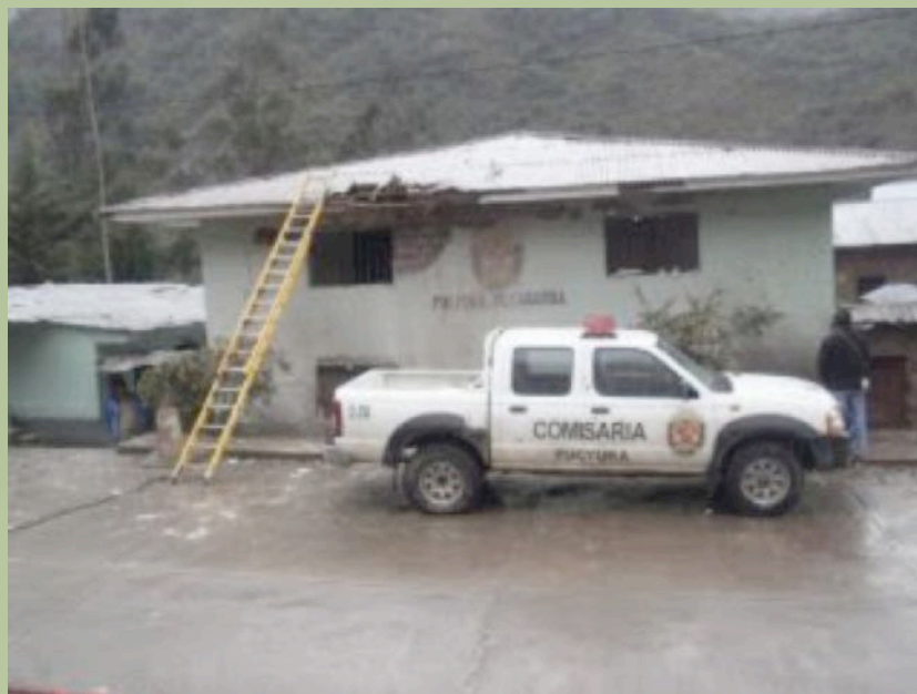
Posto de policía en Pucyura tras o ataque de Sendero Luminoso

Algunhas axencias paralizaron o envío de turistas a Vilcabamba . Isto provocou unha freada moi importante ao proxecto de turismo vivencial que Labañou Solidaria viña promovendo no val de Vilcabamba , incluíndo a paralización do proxecto de turismo social que tiñamos acordado coa Dirección Rexional de Turismo do Cusco.