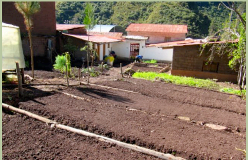
Horto demostrativo na casa de Labañou en Vilcabamba

Igualmente estableceuse unha "Folla de ruta" coa municipalidade co obxecto de compartir un diagnóstico de situación, así como os obxectivos, actividades e proxectos que Labañou Solidaria vén promovendo en Vilcabamba, co obxecto de ir traspasando a iniciativa e o protagonismo á propia comunidade vilcabambina.