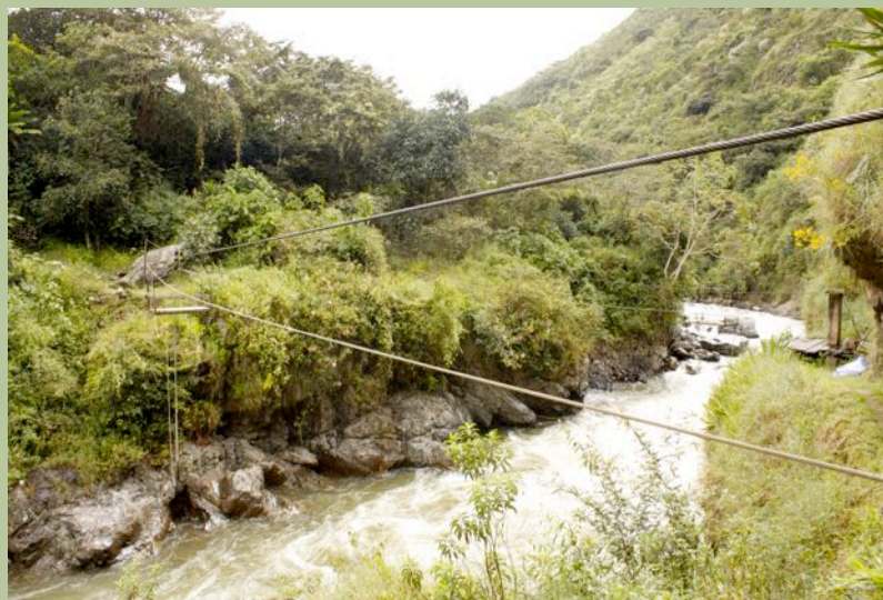
Oroya, Sistema para salvar barrancos

As circunstancias obrígnos a reformular o noso papel e adaptar os nosos obxectivos ás novas circunstancias. Nesta fase non poderemos asumir grandes investimentos en recursos económicos e materiais; pero si podemos achegar moito en asesoría técnica, co obxectivo de que os actores locais (poboación, técnicos e institucións